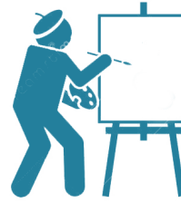
Barbizon, village des peintres www.barbizon.fr/