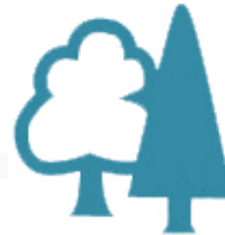
Forêt de Fontainebleau www.fontainebleau-tourisme.com