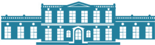
Château de Versailles www.chateauversailles.fr